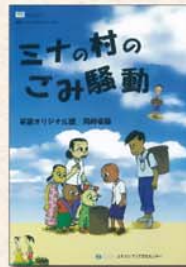
『ミナの村のごみ騒動』