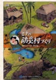
『ミナの防災村づくり』