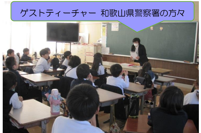
2年生 真剣に考えたキッズサポートスクール