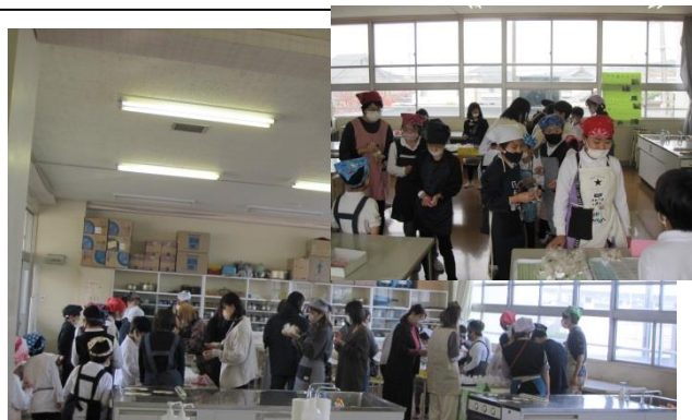
たんぼぼ学級 お家の人たちといっしょに おいもまつり☆