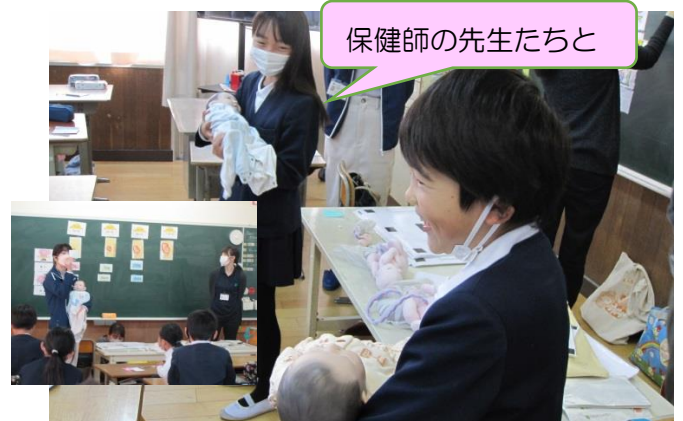
4年生 命の大切さを知る授業でやさしい笑顔