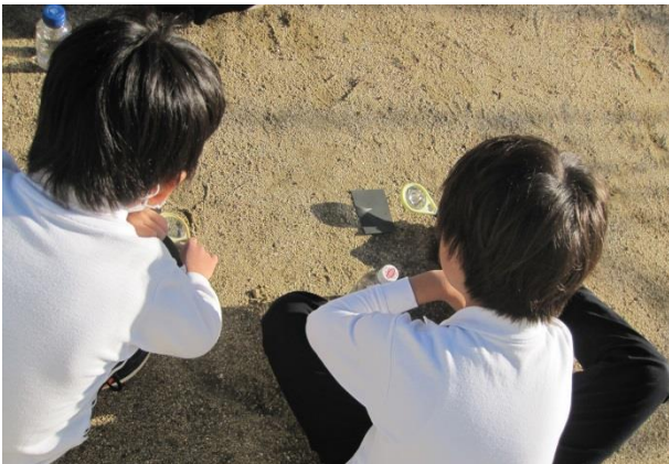
3年生 虫めがねで太陽の光を集めた理科実験