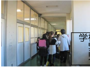
学校開放最終日 緊急時における 児童引き渡し訓練実施