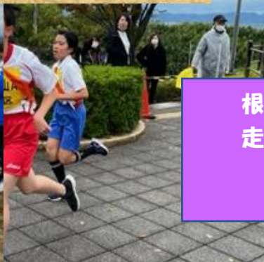
根来小チームのタスキをつなげて 走り抜ける姿に感動☆☆☆ おめでとう!!