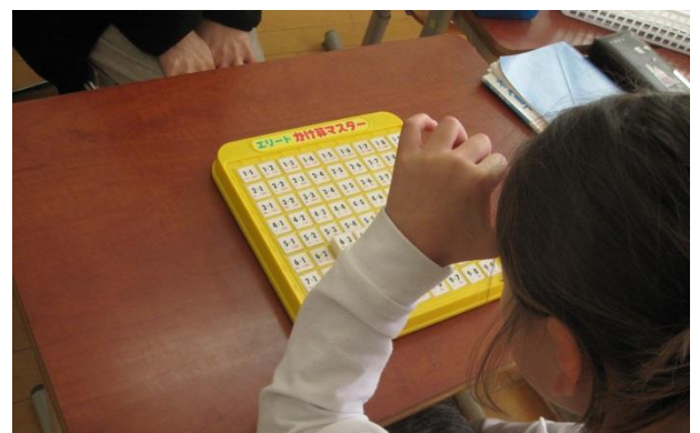
サポートルーム 教具を使って九九を視覚的におぼえた九九