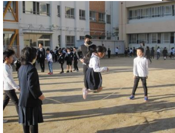
朝の運動 マラソン・ 大縄8の字跳び