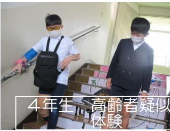
4年生 高齢者疑似体験