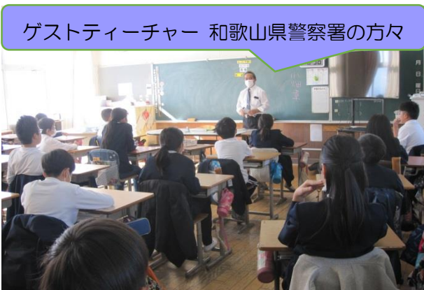
5年生 犯罪なども知ったキッズサポートスクール