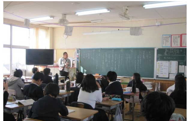
6年生 1年生との活動を計画した学級会