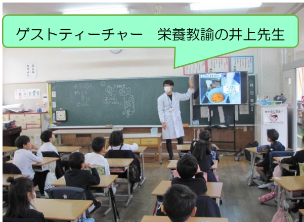
1年生 給食の作り方も初めて知った食育教室