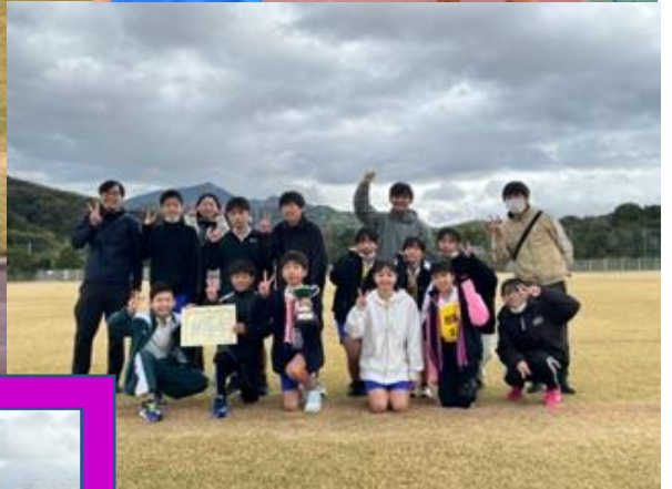
第13回桃源郷駅伝競走大会 11/18(土) 女子11位 男子3位入賞(2年連続)