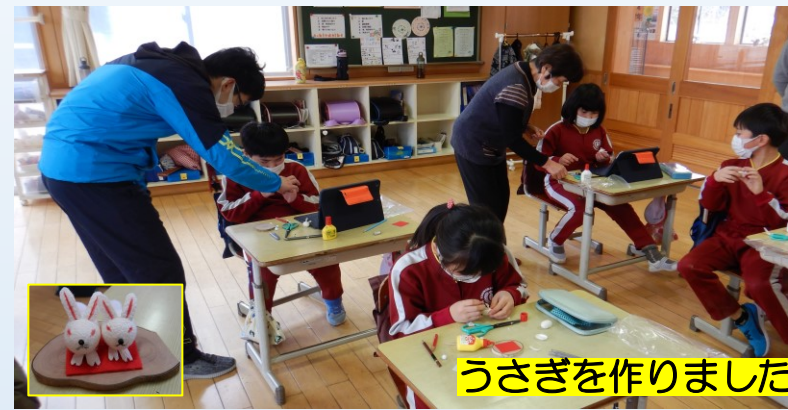
うさぎを作りました