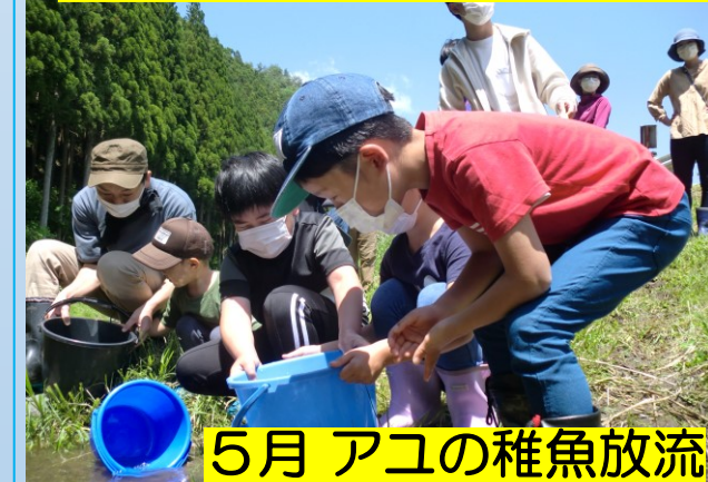
5月 アユの稚魚放流