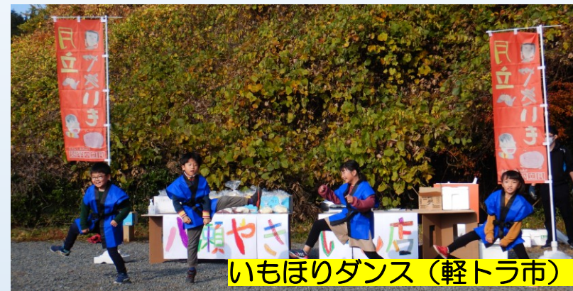
いもほりダンス (軽トラ市)

【目標】自分たちが住む八瀬地域の人や自然、社会に進んで関わりをもち、体験的な活動などを見直しながらかつて大切にしていこうとする。