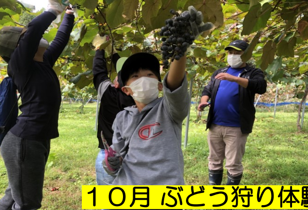
10月 ぶどう狩り体験