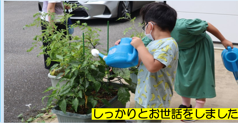
しっかりとお世話をしました