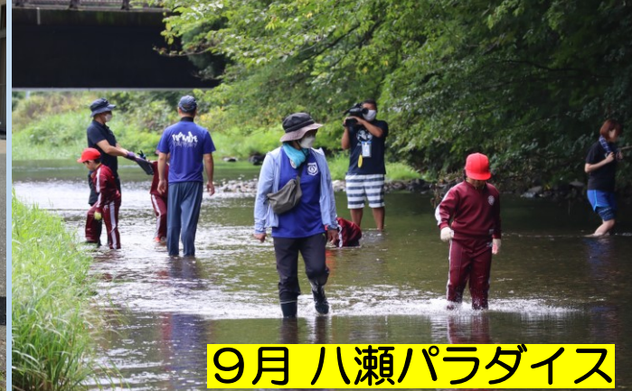
9月 八瀬パラダイス