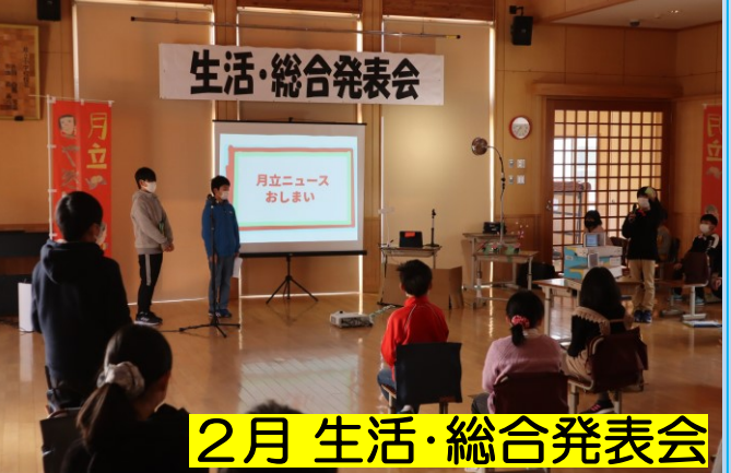
2月 生活・総合発表会