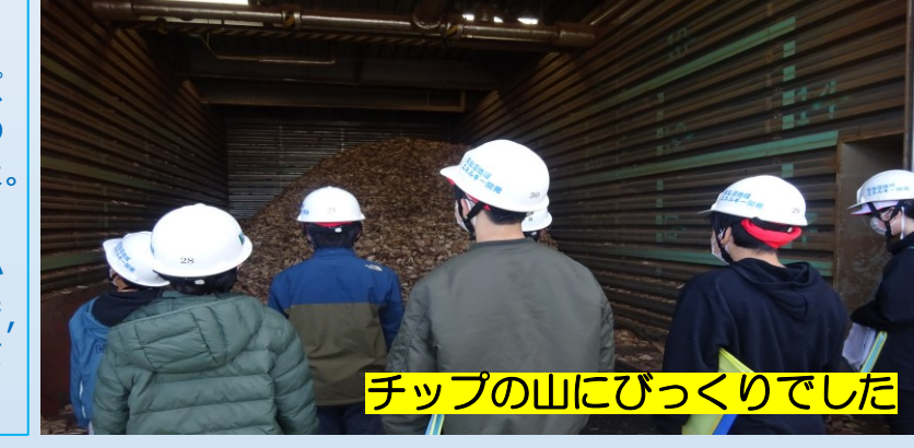
チップの山にびっくりでした