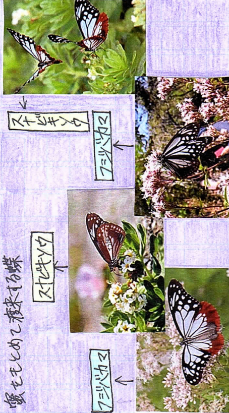
蜜をもとめて渡来する蝶

アサギマダラは、渡 りをする優雅な蝶で、 5月上旬から6月上旬 頃、姫島のみつけ海岸 のスタビキソウの蜜を もとめて、南の地から 渡来し、休息したのち、 涼しい北の地に向かっ て飛び立ちます。10月 中旬頃、世代を交代し た蝶が、北から暖かい 南の地へと向かう途中 で、姫島の金地区のフ