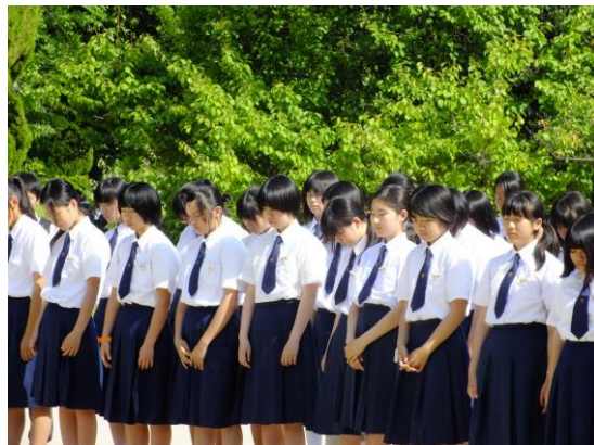
平和記念資料館での様子