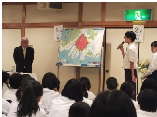
人権ひびきあいの日：道徳授業の様子