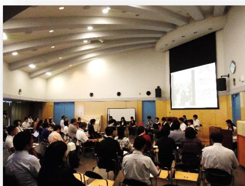
ユネスコスクール神奈川県大会 (湘南学園中学校高等学校 2017)