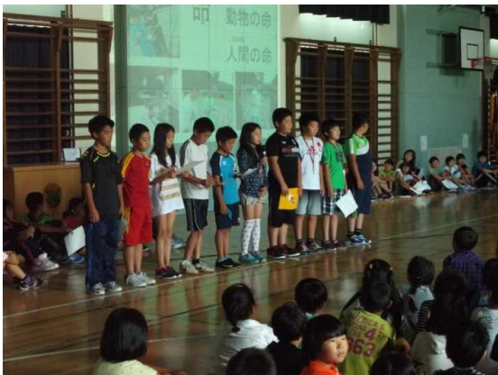
写真：2月のユネスコ集会から

本校では総合的な学習の時間の取組に加えて、ボランティア委員会がユネスコ活動に取り組んでいる。