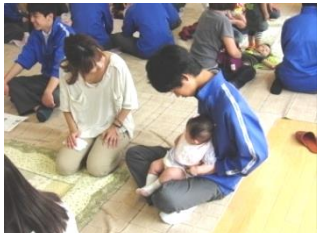
赤ちゃんてすこい

○技術・家庭科 1,3学年では、NPO法人日本時代衣装文化保存会の支援を受け、日本文化の伝統にふれる「和装着付け」の学習をする。異文化を理解するためには先ず自国の文化を理解する学習をしています。