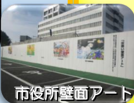
市役所壁面アート

美術部が節電をテーマにしたキャンドルナイトに、科学部は鎌ヶ谷にひまわりを育てようプロジェクトに参加しています。