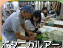
ポタニカルアート