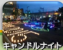
キャンドルナイト