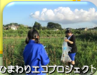
ひまわりエコプロジェクト