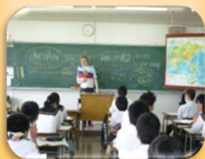
ウズベキスタンの先生