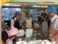
ヘルスマイト調理実習

鎌ヶ谷市と連携し、和菓子職人、ヘルスマイトさんによる実習と画家から植物の描画を学びました。