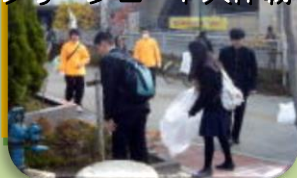
クリーンロード大作戦

生徒会のペットボトルキャップの回収、広報委員による募金活動、書き損じはがきの回収、毎年200人以上の生徒と教員、保護者がクリーンロード大作戦を行っています。