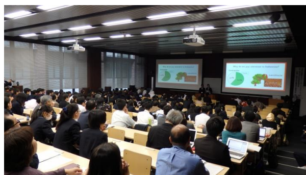
シンポジウム会場全景