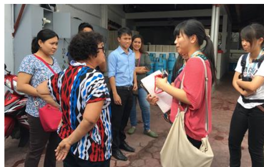
地元企業（ブコパイ）での聞き取りの様子