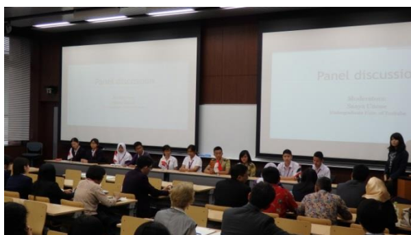
シンポジウムの発表者の様子

11 月 19 日（木）には、筑波大学農学 ESD シンポジウム（Ag-ESD）へも参加し、参加校の活動紹介と本校の国際教育のとりくみ等を発表し、大学生、大学院生に交じりポスターセッションにも参加した。