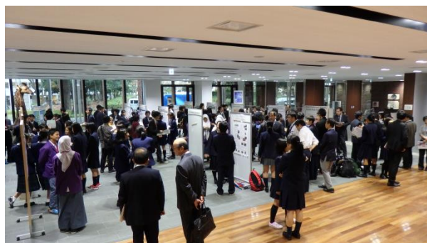
ポスターセッション会場全景