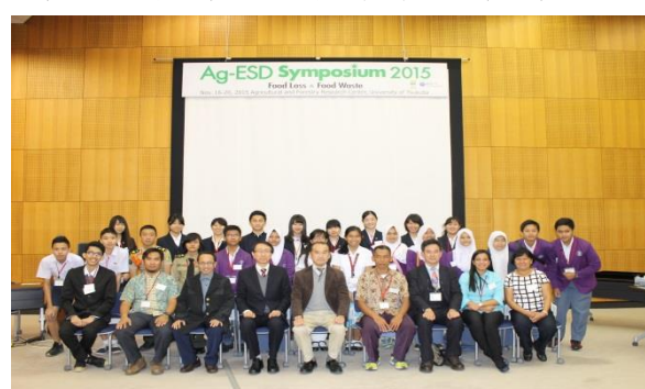
筑波国際農学 ESD にも参加しました