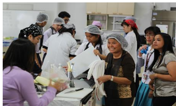
各国の参加者が調理を行うホットラックパーティー@調理室