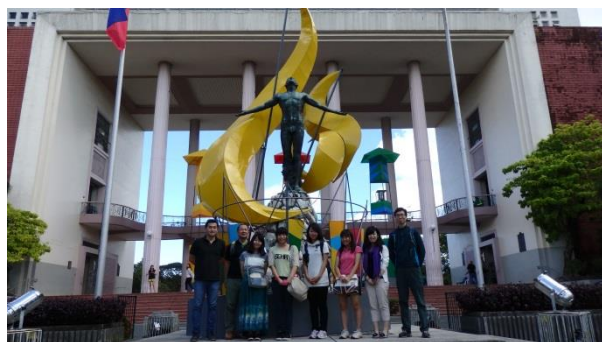
フィリピン大学正門前（AIMSP 関係者と）

B と F の生徒は、12 月下旬にインドネシアに渡航した。現地では、ジャカルタにある日系企業、ロンボク島の NGO や現地団体の協力をいただいた。生徒 E は、キルギス全土に外務省の海外危険情報が発出されているため、一村一品に運動に関するテーマを実施できる他国で実施することを条件にし、最終的にはフィリピンに渡航することになった。学内プロジェクト革新的教育プロジェクト「国際連携協定校群による IMAP（International Multilevel Academic Program）の開発」のプロジェクトと連携して実施し、フィリピン大学附属高等学校および筑波大学アセアン AIMS プロジェクトの協力を頂き実施した。プロジェクトの成果は、本校主催の「第 19 回総合学科研究大会・第 2 回総合学科研究大会」（2016 年 2 月 18・19 日）の 2 年次「t-GAP」発表会で報告した。