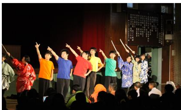
海外からの方に大人気の演劇部「忍者パフォーマンズ」