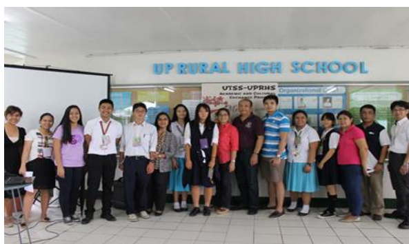
フィリピン大学附属高校での国際フィールドワーク

「課題研究に関する連携を行う海外大学・高校等の数」も、6 校から 13 校に増加している。学校内における「国際性の日常化」が実現されつつある。