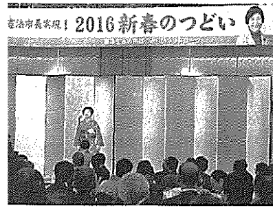
京都市長選実現! 2016新春のつどい