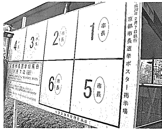
都市長選に向け、立候補者用の選挙ポスター掲示板の設置を進める業者(京都市中京区)