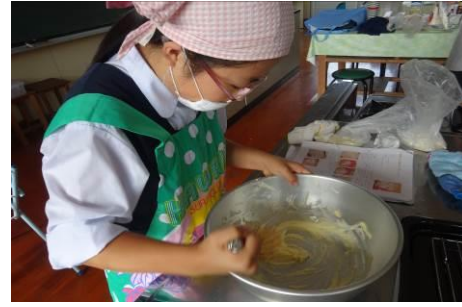
ユネスコ紹介コース：外国のお菓子作りに挑戦