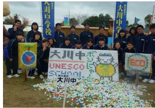
長島造形美術展に出品