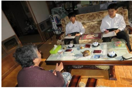
「大川学」コース：戦争体験者へのインタビュー