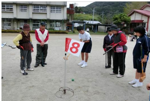
ふれあいグラウンドゴルフ