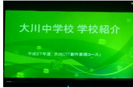
創作表現コース：文化祭で学校紹介ビデオ上映