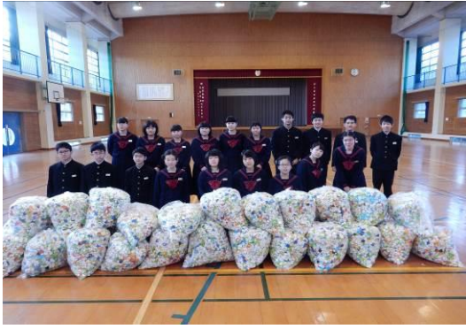
今年度の収集成果