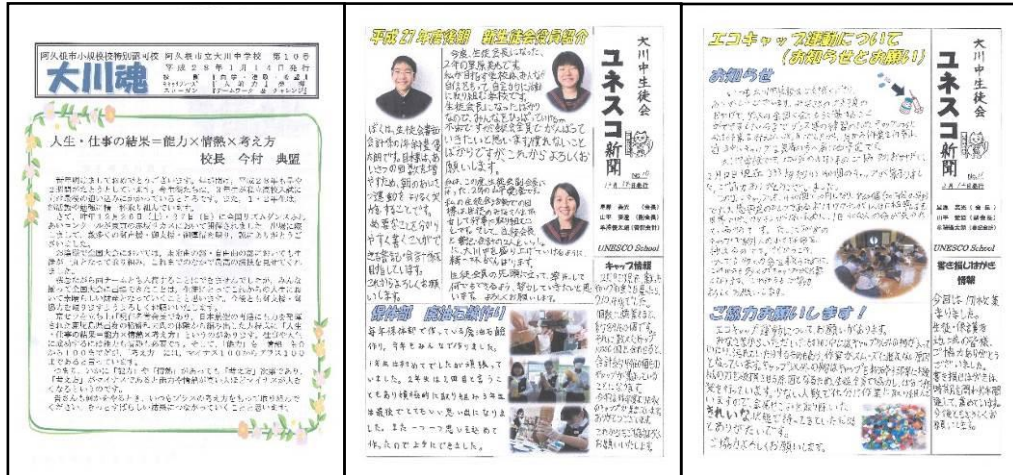
『学校便り』 及び 『ユネスコ新聞』

本校では学校便り「大川魂」を月に一度発行し、校区内の全世帯及び同市内の全学校を含む各教育機関に配付している。一昨年度から二ヶ月に一回、その裏面に生徒会本部が中心となり作成した「ユネスコ新聞」を掲載し、学校で行っている様々な活動の紹介やボランティア活動への参加呼びかけなど、多くの方々へ発信している。