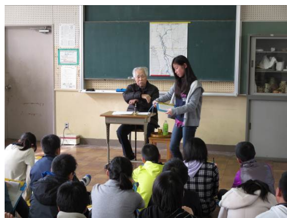
6年. 地域の方に戦争体験の話を聞く