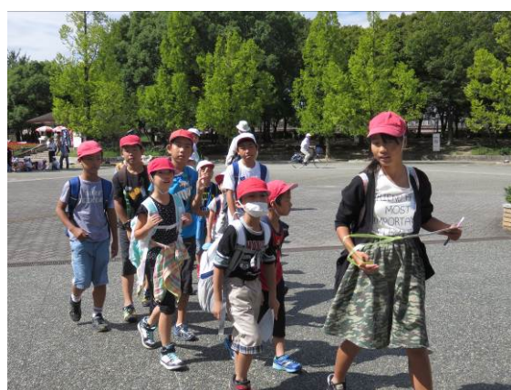
なかよし活動. 縦割り班でなかよし遠足に行く