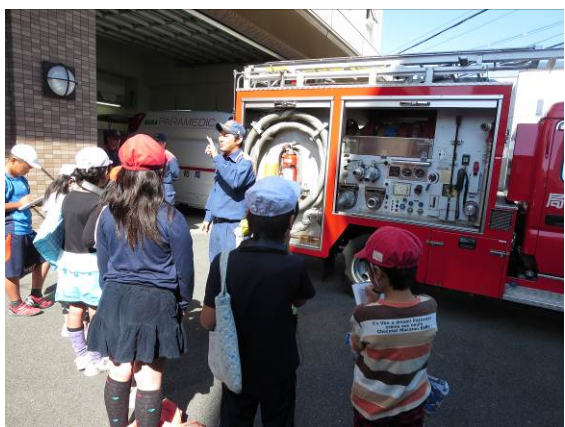
4年. 消防署での調べ学習