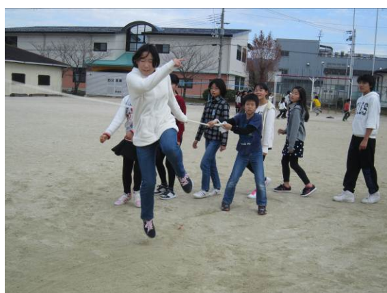
なかよし活動. 縦割り班で体育委員会主催のドッジボール大会や大なわ大会を行う