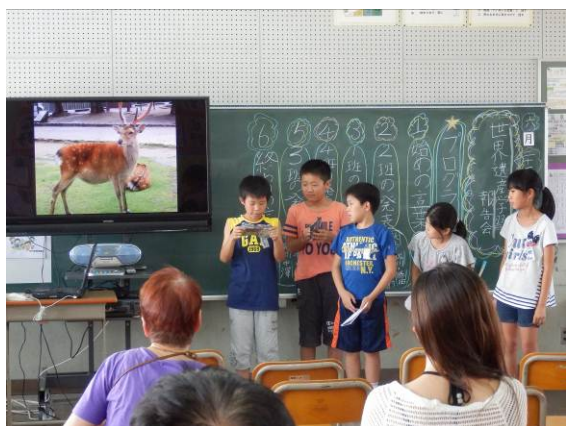
5年. グループに分かれて、世界遺産学習発表