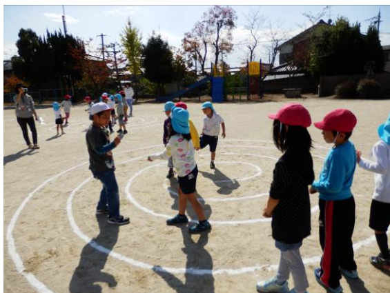
1年. こども園の子どもたちと水仙植えやゲームをして交流