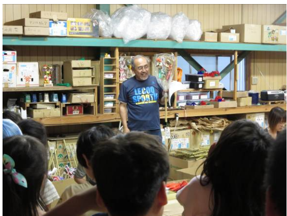
3年. 校区探検で校区の社寺や産業を調べる。近畿戎共同組合に行き、校区の産業について聞く