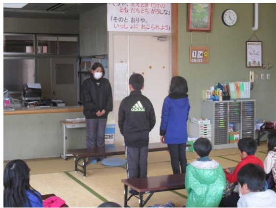
4年. 人権学習で児童館に行き、聞き取りをする