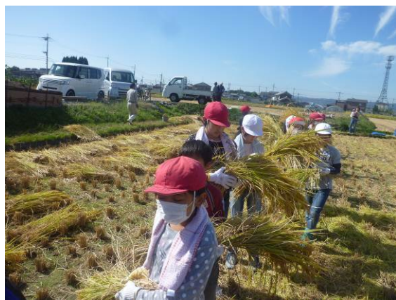
5年. 地域の方々に教えてもらって稲作作り