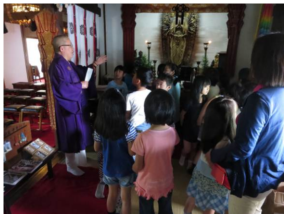
2年. まちたんけんで校区を探検し、帯解寺の住職さんに聞く