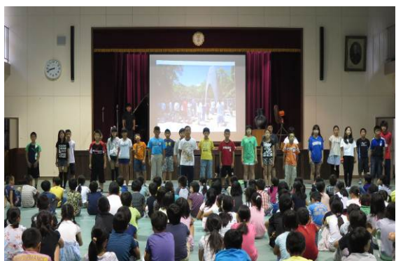
6年. 平和学習の全校へ向けての発信