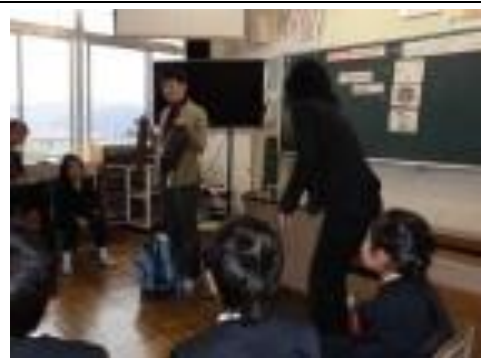
英語教科地域拠点事業