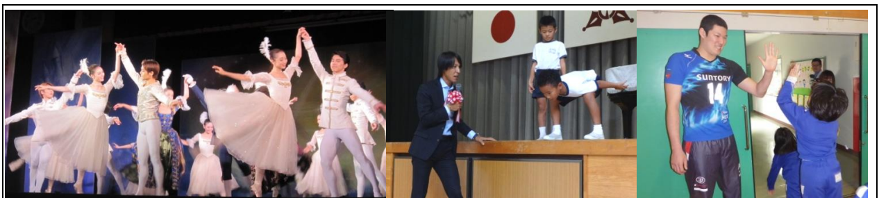
本物にふれる（芸術体験・スポーツ選手との交流会）