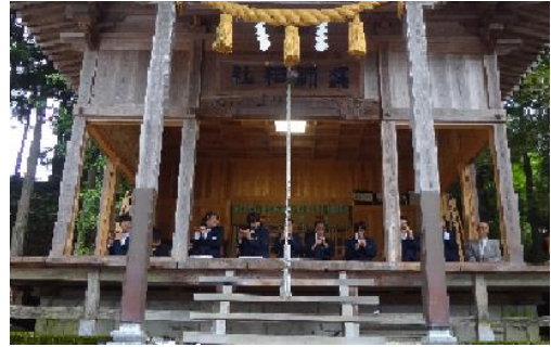
地域行事への参加