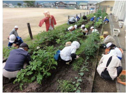
長命会の方と一緒に草取り