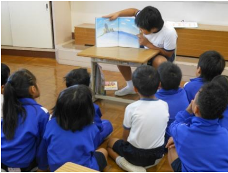
委員会から低学年への読み聞かせ