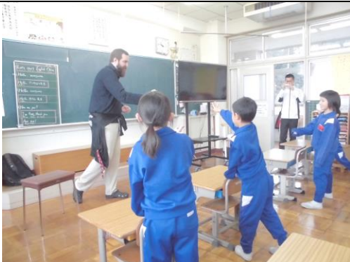
A L Tとの交流