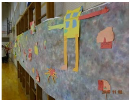
できあがった作品