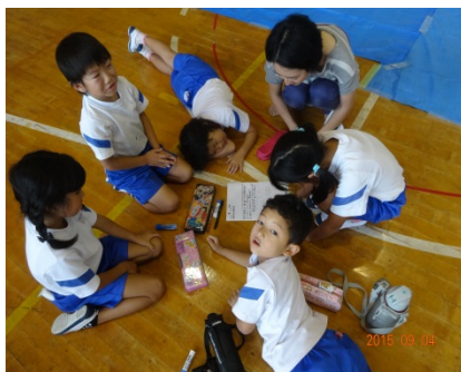
図案の検討（川に住む生き物達等について） ・指導者が各グループを回って、指導する