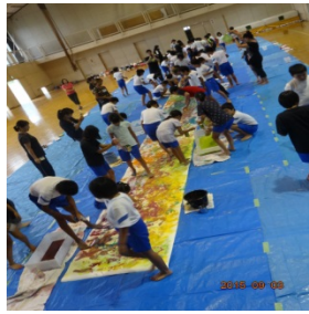
児童による作業風景（川の水の色塗り）