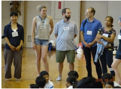
「みんなで20メートルの川をつくろう」 の講師陣（地元画家：外国人を含む）