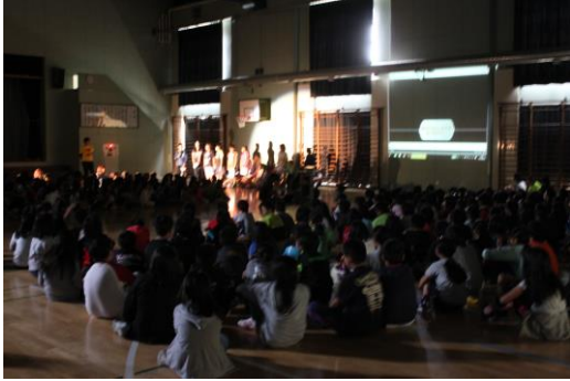
写真：9月のユネスコ集会から

本校では総合的な学習の時間の取組に加えて、ボランティア委員会がユネスコ活動に取り組んでいる。