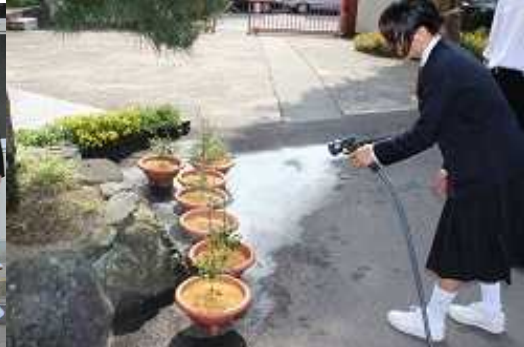
大きめのポットに植え替えた様子