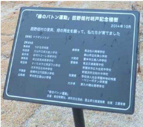
植樹された岩手県にある記念プレート