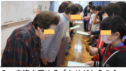
感謝を伝え、交流を深める「ありがとうの会」

お世話になった年長者や地域の方々を招いて「ありがとうの会」を実施し、感謝の気持ちを伝えるとともに交流を深める。また、親子で点字を学ぶ学習なども行う。