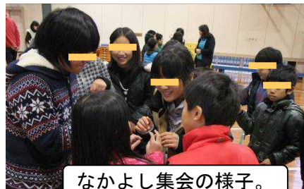
なかよし集会の様子。