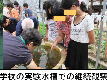
学校の実験水槽での継続観察。