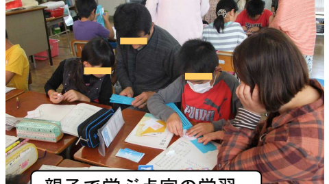
親子で学ぶ点字の学習。