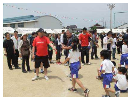
(児童引き渡し訓練)