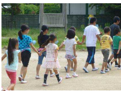
(ペアになって二次避難)