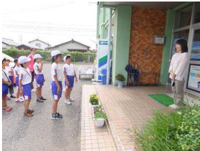
(花の苗のプレゼント)