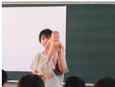
(誕生学の授業・中学年)