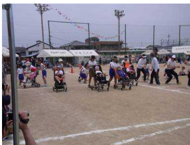
(運動会 浮小リレー)