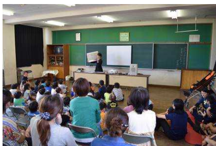
(誕生学の授業・低学年)