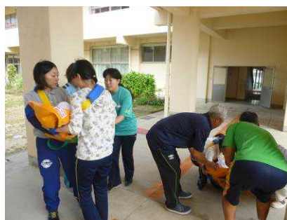
(肢体不自由児の避難訓練)