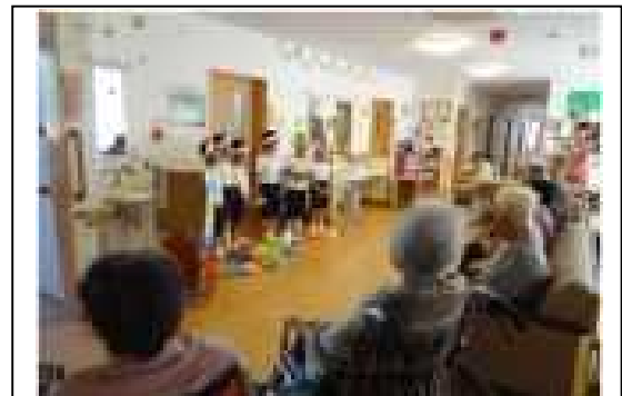
学級ごとの施設訪問