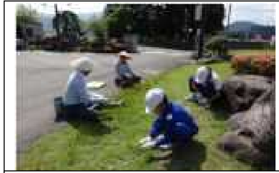
長命会の方と一緒に草取り