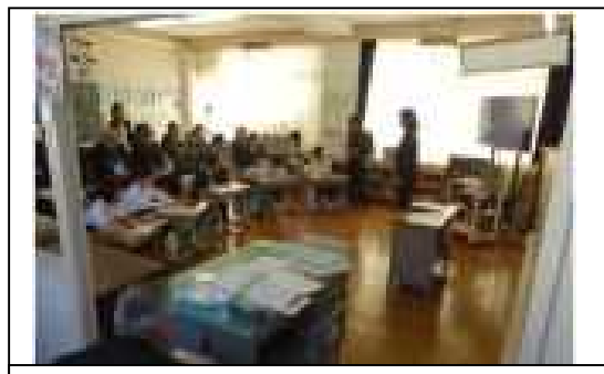
英語教育強化地域拠点事業