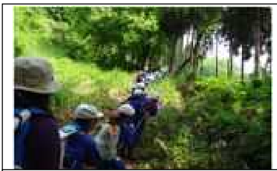
野向町めぐり（高尾山登山）