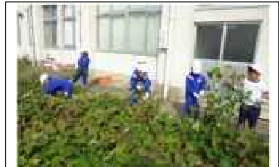
学級園での野菜作り