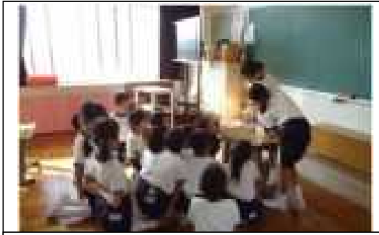
委員会から低学年への読み聞かせ