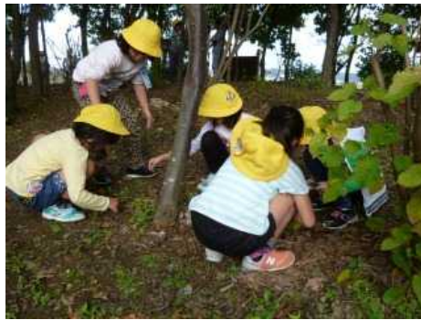
生活科「秋さがし」1年