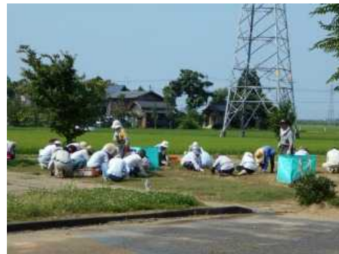
地域の老人会による草取り