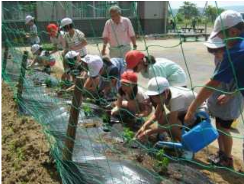
グリーンカーテン作り（ゴーヤの苗植え）

見附市のアースプロジェクト事業を受けて、保護者・地域住民との協働で、「グラウンドの芝生化」「グリーンカーテンづくり」に取り組んだ。この活動を通して、葛巻地区全体の環境に目を向け、さらには地球規模の環境保全への関心を高めようと努めた。