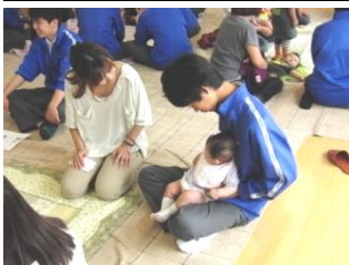
赤ちゃんてすこい

○技術・家庭科3学年では、NPO法人日本時代衣装文化保存会の支援を受け、日本文化の伝統にふれる「和装着付け」の学習をする。異文化を理解するためには先ず自国の文化を理解する学習をしています。