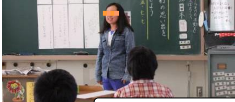
6年生国語科の学習の様子。

教科教育では、言語活動が充実するよう学習を展開し、児童たちの表現力・思考力・コミュニケーション能力が高まるよう取組を継続している。