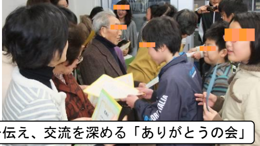
感謝を伝え、交流を深める「ありがとうの会」

お世話になった年長者や地域の方々を招いて「ありがとうの会」を実施し、感謝の気持ちを伝えるとともに交流を深める。また、親子で点字を学ぶ学習なども行う。