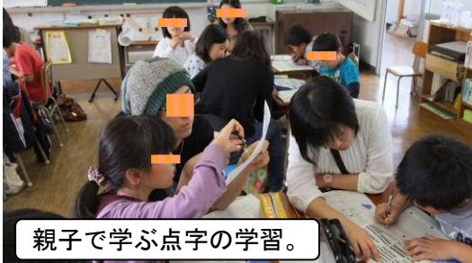
親子で学ぶ点字の学習。