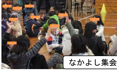
なかよし集会の様子。