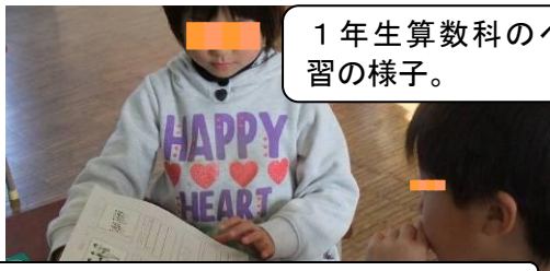
1年生算数科のペア学習の様子。