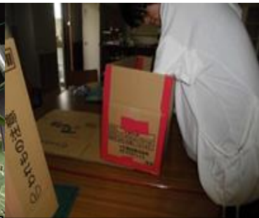
②の写真（ダンボールコンポスト製作）