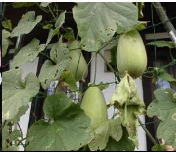
②の写真（みどりのカーテン）