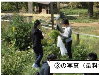
③の写真（染料採取と染液抽出の様子）