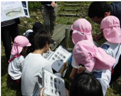
①の写真（保育園児とともに水中生物の観察）

他者に伝える活動として、兵庫県主催「ひょうご担い手サミット」に参加し、ポスター展示・発表を行った。また、NPO、学生などの環境保全活動に取り組む人々とともにグループディスカッションに参加した。これまで人前に立ったことのない学園生が、約300人の参加者の前で、活動紹介をスピーチし、ディスカッションに参加できた。学園生の自己肯定感を高め、本人・保護者が自らの成長を実感した。