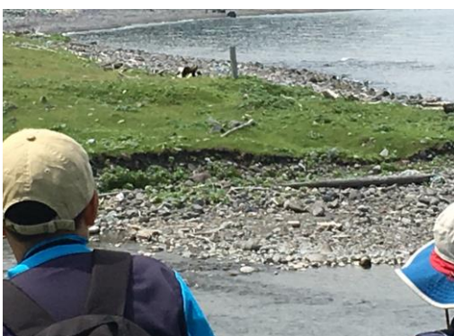
② の写真 （フィールドワークでクマと遭遇）