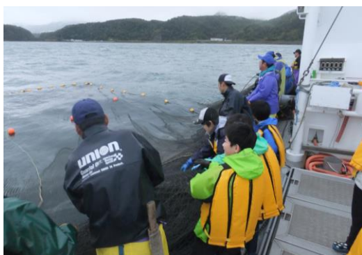
① の写真（鮭の定置網起こし体験）

1年生から4年生で学校独自の教科「英語」を週1時間設定し、1年生から9年生までの系統性を意識した教育課程を編成・実施した。また、11月中旬に他市町のALTをゲストティーチャーとして招き、イングリッシュキャンパスを開催した。当日は、児童生徒が積極的に英語を使ってコミュニケーションを図っており、多様な文化に触れ合うことができた。