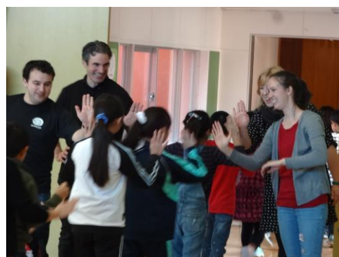
③ の写真（イングリッシュキャンパス）