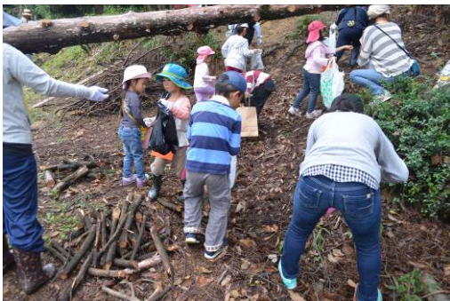
② 親子での森林保全活動

ユネスコスクールを目指している地域の小学校との相互交流を行い、本園教諭が幼児の取り組みを小学校児童に話をしたり、本園教諭が小学校の授業を参観し、その後の研究会に出席したりした。そのことで、それぞれの校種でのE S Dの取り組みを学ぶ機会となった。