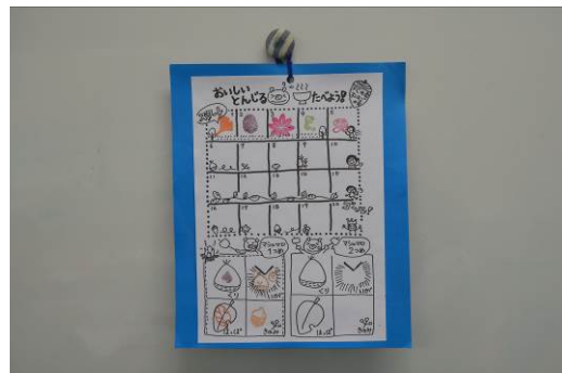
② 栗の枝などを集めるポイントカード