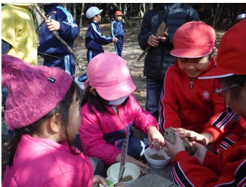
③ 小学生との森での交流