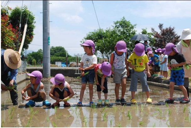
① の写真（年長児による稲の田植え）

11月 大根収穫・試食（全園児） タマネギ定植（年長児） おにぎりを作って試食（年長児）