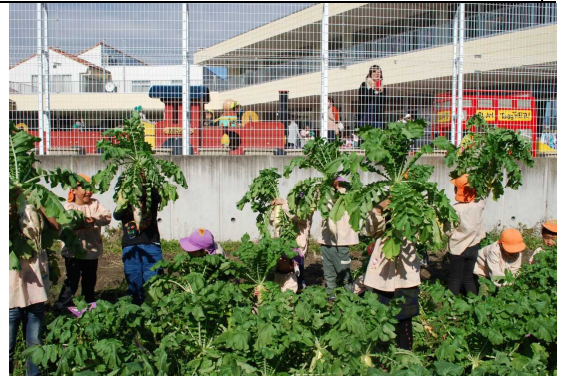
④ の写真（ダイコンの収穫）