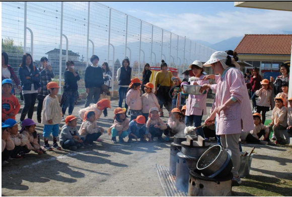
③ の写真（収穫した稲で炊飯）