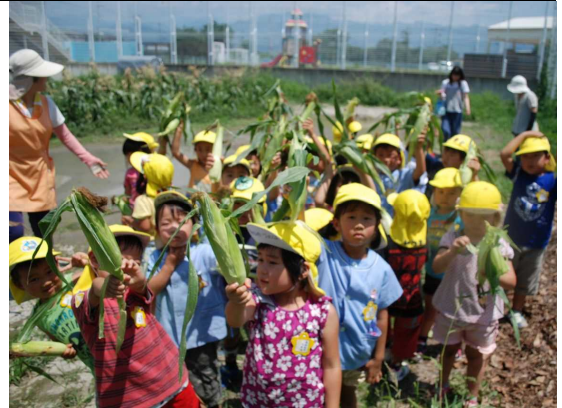
② の写真（トウモロコシ収穫）