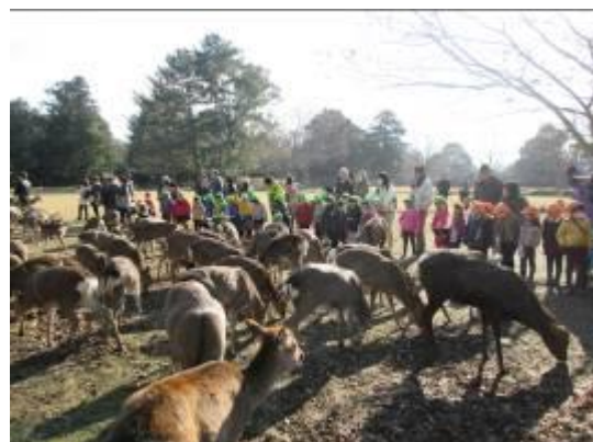
12月 園外保育 鹿寄せ