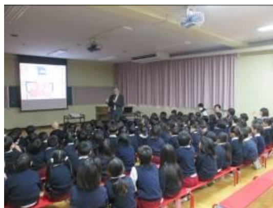
「遠足で見たことある！！」