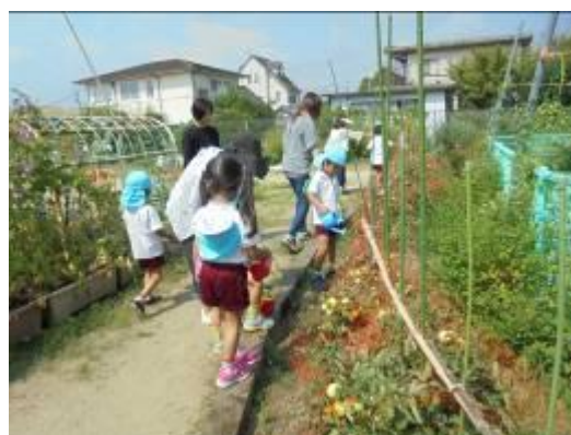
5月 地域の方にアドバイスをいただきながら、園の畑にトマトの苗を植えました。