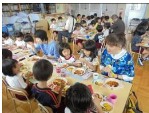
9月 お世話になった方をお迎えしてみんなで収穫を祝うリリコパーティーを開きました。