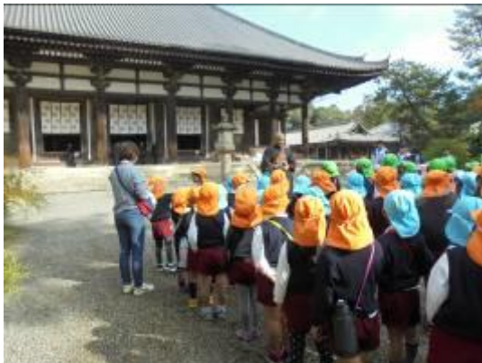
11月 園外保育 唐招提寺