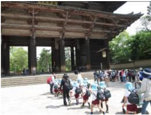
4月 春の遠足東大寺

日々、身近に世界遺産のある生活をしていますが、昔から大切に守られてきたお話を聞いたり、実際に見たりしたことでより親しみをもつようになり、奈良を大切に思う気持ちや今までに守ってきた人々の思いを知るなど、伝統文化を大切に思う気持ちが育ちました。