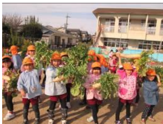
さつまいも・大根の収穫をしました。