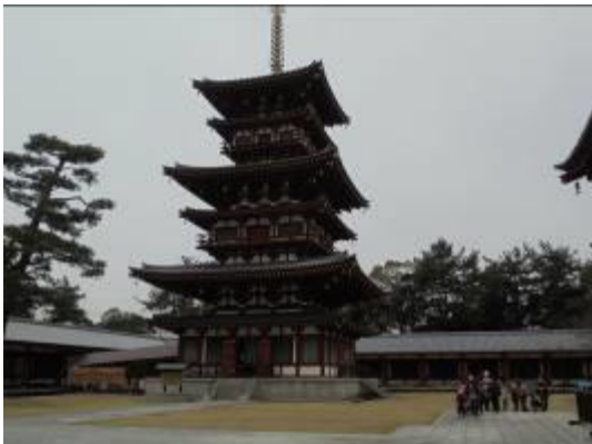
3月 園外保育 薬師寺