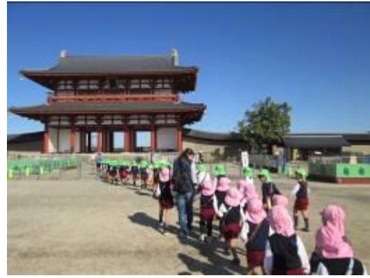
11月 園外保育 平城宮跡へドングリ拾い