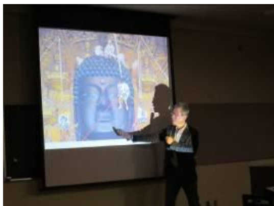
「1年に一回体をきれいにするんだよ」