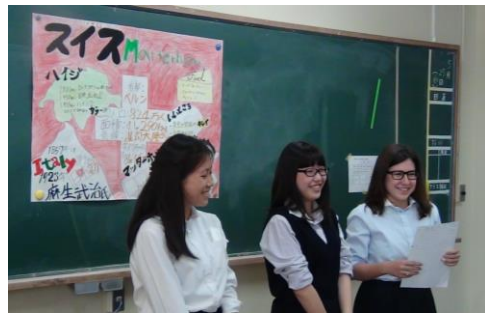
世界遺産を抱える国を紹介