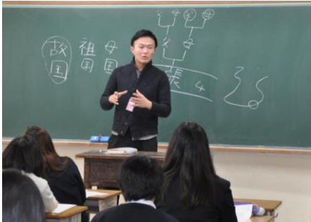
在日外国人問題についての講演