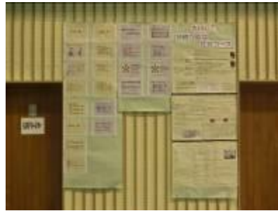
持続可能な社会コース：活動のまとめ・文化祭発表の様子