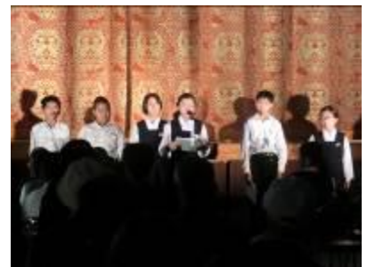
エココース：活動のまとめ・文化祭発表の様子