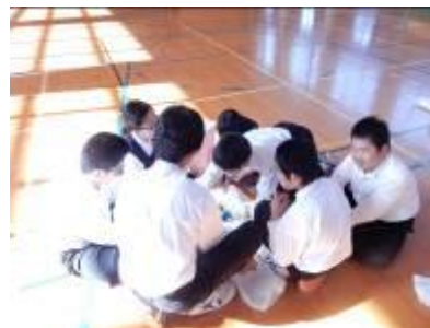
ペットボトルキャップを分別している様子