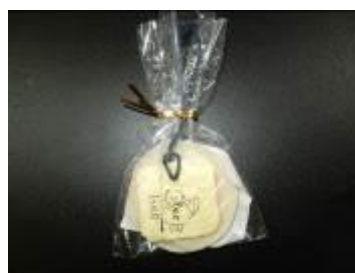
廃油石けん作りの様子と文化祭に来ていただいた方々へ配布した廃油石けん