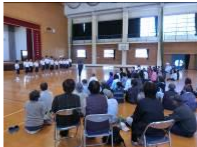
体育館での発表風景