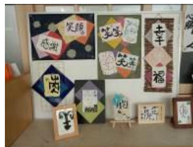
「和のインテリア」（家庭教育学級）で作成した作品（エコ活動で作成した和紙も使用）

この活動成果を11月に行った「大川小中合同文化祭」にて発表することができた。エココースで行ったエコ活動の一つである「和紙作り」で作成した和紙については、小中合同の家庭教育学級の「和のインテリア」活動で使用することができた。その作品も小中合同文化祭や市文化祭で展示することができた。