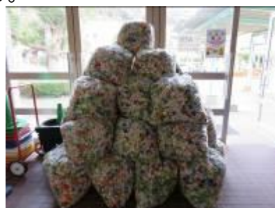
今年度の収集成果