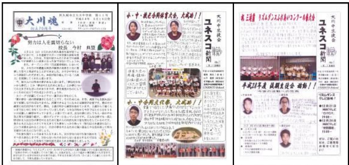
『学校便り』 及び 『ユネスコ新聞』

本校では学校便り「大川魂」を月に一度発行し、校区内の全世帯及び同市内の全学校を含む各教育機関に配付している。平成25年度から二か月に一回、その裏面に生徒会本部が中心となり作成した「ユネスコ新聞」を掲載し、学校で行っているユネスコ活動の紹介やボランティア活動への参加呼びかけなど、多くの方々へ発信している。