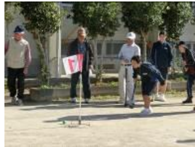
ふれあいグラウンドゴルフの様子