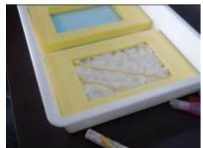
エココース：エコ活動体験の様子（給食で出る牛乳のパックを利用し、和紙を作成している）