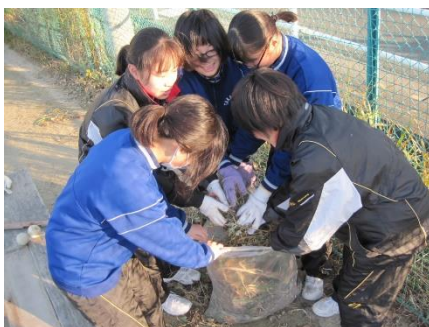
高師台クリーンアップ

環境委員会が中心となってペットボトル・エコキャップ回収を行い、リサイクル意識を高める活動を行っています。また、実践的な美化活動として、生徒会が中心となり、休日の土曜日の早朝(12月10日)に校区内の公園や歩道等の清掃活動を行いました。この活動はボランティアによるもので、500名以上の参加者がありました。こうして校区を自分たちの力で美しくしようとする意識を育んでいます。