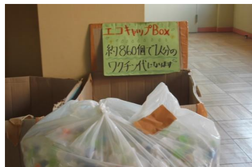
エコキャップ回収