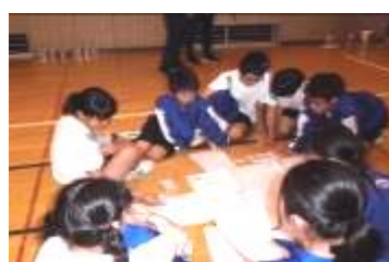
避難所運営シミュレーション