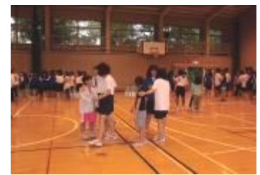
小学生とバディを組ん