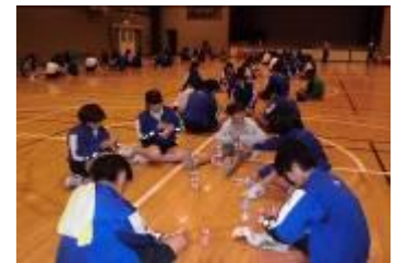
小学生と一緒に朝