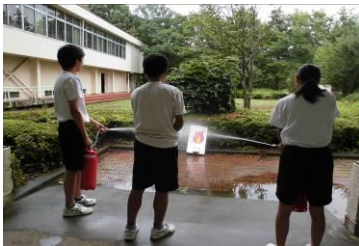
初期消火訓練 で行動