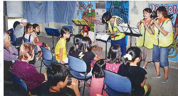
リコーダー演奏を披露する永田台小学校の教諭ら まちづくり委員会の約30人のメンバーを中心に運営しており2回目。ゲームやフリーマーケット、模擬店などが並び、大人と子どもが一緒に楽しむ楽しんだ。

「つながり祭」で異世代集う 南永田団地 空き店舗活用し2回目 南永田団地内にある商店街の空き店舗を活用して異世代交流を図るイベント「つながり祭」が6月11日に行われた。イベントは空き店舗の活用を考える組織として3月に設立した「永田みなみ台まちづくり委員会」の約30人のメンバーを中心に運営しており2回目。ゲームやフリーマーケット、模擬店などが並び、大人と子どもが一緒に楽しむ楽しんだ。