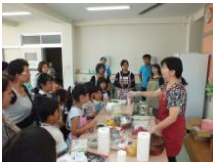
カナリーニョの会でブラジル料理作り

本校は、外国人児童、特別支援学級児童も多く、文化、言語、国籍をはじめとするさまざまな違いをお互いに理解し、認め合いながら成長していくことが大切だと考えている。11月には、国際学級の教員と外国（ブラジル）人児童の保護者の計画で、カナリーニョの会（料理教室）を開催し児童や保護者に参加してもらっている。今年は『パンケーキ』というミートソースを小麦粉の生地で包んだブラジルの料理を作り大好評であった。