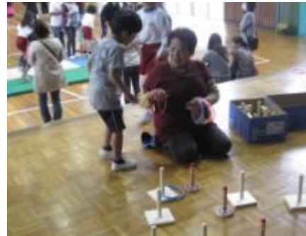
老人会の方と一緒に輪投げで遊ぶ

1年生の生活科では、日本に昔から伝わる遊びを学ぶ。10月には『昔遊びの会』を開き、校区の老人会の方々から伝統的な遊びを教えていただいた。こま回しや凧揚げ、お手玉等、お年寄りや友達とかかわりながら楽しむことができた。