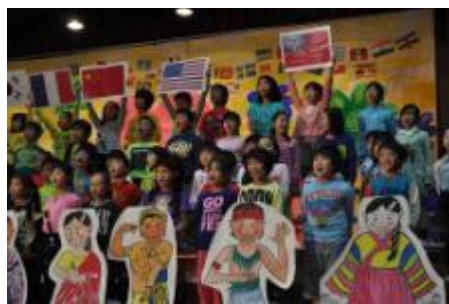
学芸会で外国の歌を歌う3年生

物・風景、ポルトガル語などを教えてもらい、一緒にブラジルの遊びを楽しんだ。『ブラジルのお菓子作り』では、教員の知人や保護者に講師になってもらい、『ブリディオ』を作った。ポルトガル語での説明を本校のブラジル国籍の児童が通訳する場面もあった。子どもたちは、「日本語もポルトガル語も話せてすごい。」「家でも作ってみたい。」「ブラジルのことをもっと知りたい。」などの感想をもった。3年生は、学習のまとめとして学芸会でいろいろな国のあいさつや歌、国旗や民族衣装を披露した。