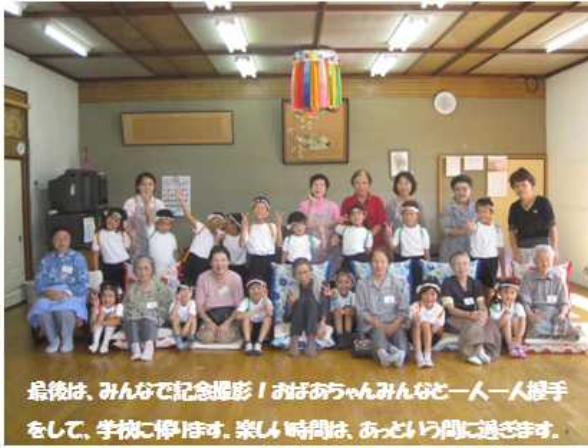
最後は、みんなで記念撮影！おばあちゃんみんなと一人一人握手をして、学校に帰ります。楽しい時間は、あっという間に過ぎます。

10月初めには、小学校初めての夏休みのお話を聞いていただいたり、運動会で踊った「ロックハ木節」を見ていただいたりしました。